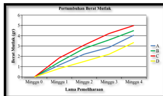
Gambar 2. Grafik pertumbuhan berat mutlak benih ikan nila

Perlakuan pemberian pakan yang berbeda pada benih ikan nila selama 28 hari menghasilkan rata-rata pertumbuhan berat mutlak yang berbeda. Hal ini dapat dilihat pada Gambar 2 berikut: