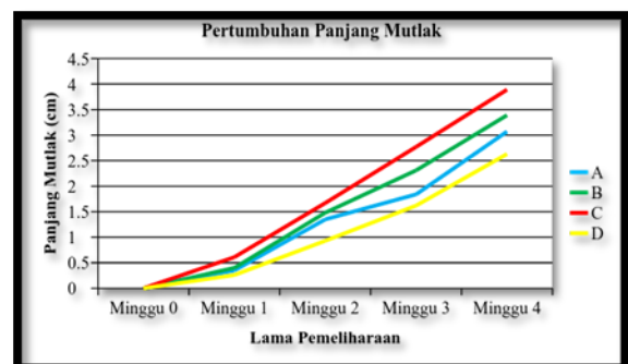
Gambar 1. Grafik pertumbuhan panjang mutlak benih ikan nila

Hasil perhitungan panjang mutlak benih ikan nila ( Oreochromis niloticus ) sesuai perlakuan pemberian pakan yang berbeda selama 28 hari menunjukkan pertumbuhan panjang mutlak seperti yang terlihat pada Gambar 1.