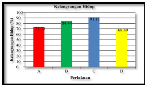
Gambar 4 Kelangsungan Hidup Benih Ikan Nila

nila yang diberi pakan A, B, C, dan D berbeda-beda. Kelangsungan hidup tertinggi diperoleh pada benih ikan nila yang diberi pakan C yaitu sebesar 91,11%, sedangkan yang terendah secara berturut-turut adalah yang diberi pakan B, A, dan D. Rendahnya kelangsungan hidup benih ikan nila selama penelitian khususnya pada pakan D dipengaruhi oleh kandungan nutrisi pakan D yang diduga tidak cukup untuk mendukung kebutuhan pokok ikan. Sebagaimana Harun (2007)